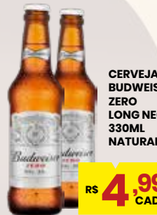
CERVEJA BUDWEISER ZERO LONG NECK 330ML NATURAL