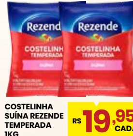
COSTELINHA SUÍNA REZENDE TEMPERADA 1KG