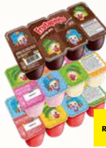
QUEIJO PETIT SUISSE FRUTAPINHO BANDEJA 320G