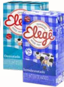
LEITE ELEGÊ UHT SEMIDESNATADO OU DESNATADO 1L