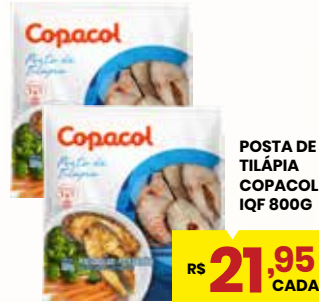
POSTA DE TILÁPIA COPACOL IQF 800G