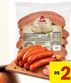
LINGUIÇA TIPO CALABRESA EDER