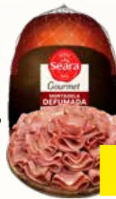
MORTADELA DEFUMADA SEARA GOURMET