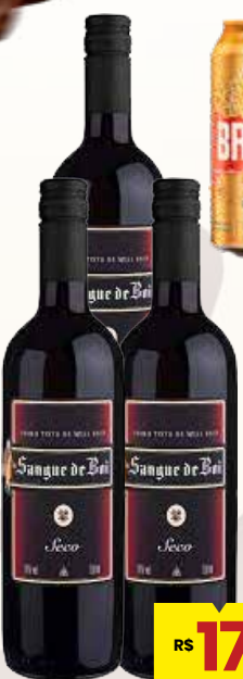
VINHO SANGUE DE BOI 750ML