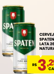
CERVEJA SPATEN LATA 269ML NATURAL