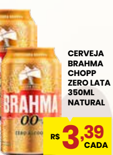
CERVEJA BRAHMA CHOPP ZERO LATA 350ML NATURAL