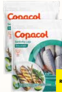
SARDINHA COPACOL LAJE EVISCERADA CONGELADA 800G