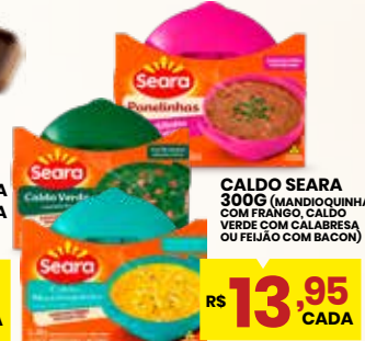
CALDO SEARA 300G (MANDIOQUINHA COM FRANGO, CALDO VERDE COM CALABRESA OU FEIJÃO COM BACON)