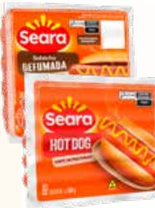
SALSICHA HOT DOG SEARA DEFUMADA OU TRADICIONAL 500G