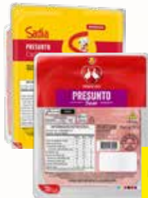
PRESUNTO FATIADO SADIA 180G OU PERDIGÃO 200G