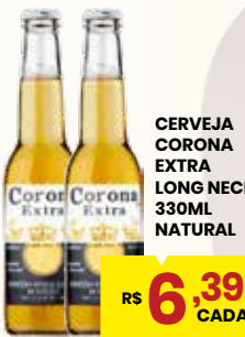
CERVEJA CORONA EXTRA LONG NECK 330ML NATURAL