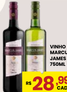
VINHO MARCUS JAMES 750ML