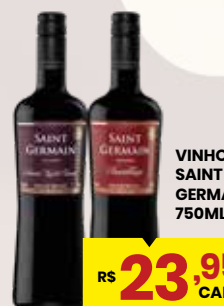
VINHO SAINT GERMAIN 750ML