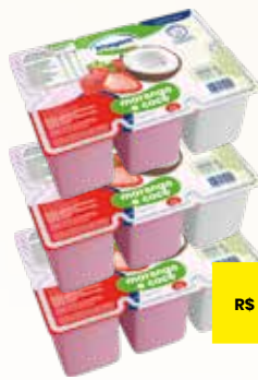
BEBIDA LÁCTEA IMAGEM BANDEJA 510G