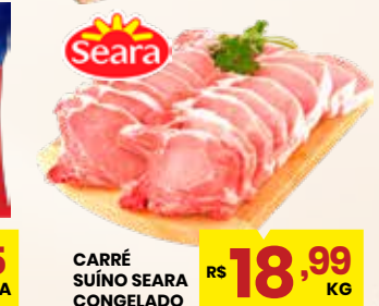
CARRÉ SUÍNO SEARA CONGELADO