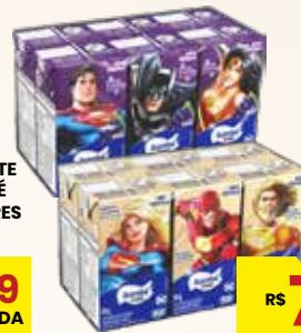
LEITE FERMENTADO ITAMBÉ SABORES TP 480G