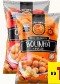
MINI SALGADOS TOP SABORES CONGELADO 300G