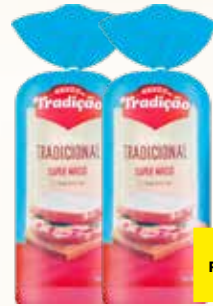
PÃO DE FORMA TRADIÇÃO TRADICIONAL 400G