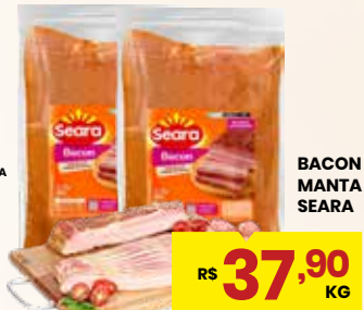
BACON MANTA SEARA