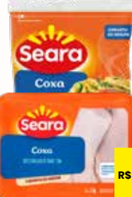
COXA DE FRANGO SEARA BANDEJA OU IQF 1KG