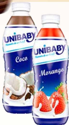
BEBIDA LÁCTEA UNIBABY GARRAFA 800G