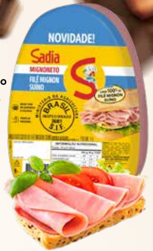
FILÉ MIGNON SUÍNO SADIA MIGNONETO