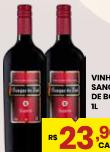
VINHO SANGUE DE BOI 1L