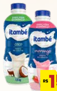
IOGURTE ITAMBÉ SABORES 1,15KG