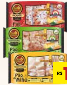
PÃO DE ALHO TOP SABORES 350G