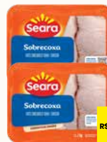
SOBRECOXA DE FRANGO SEARA BANDEJA 1KG