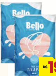
FILÉ DE TILÁPIA BELLO IQF 400G